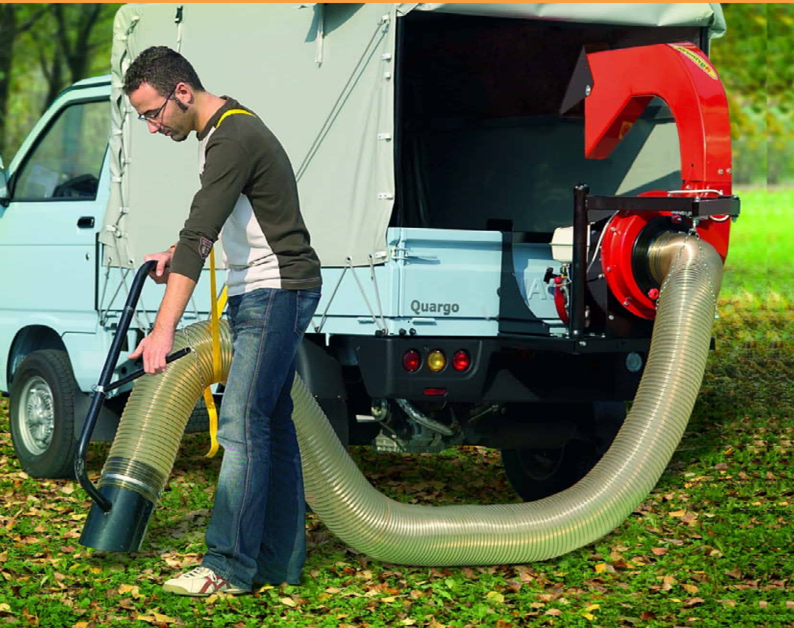
Schlauchhalter OPTIONAL AS1270

OLGA ist ein Laubsauger für Hecklader, der für die Reinigung und das Saugen von Laub, Gras und leichtem Abfall auf Parkplätzen, Parkanlagen, Camping, Straßen und Höfen